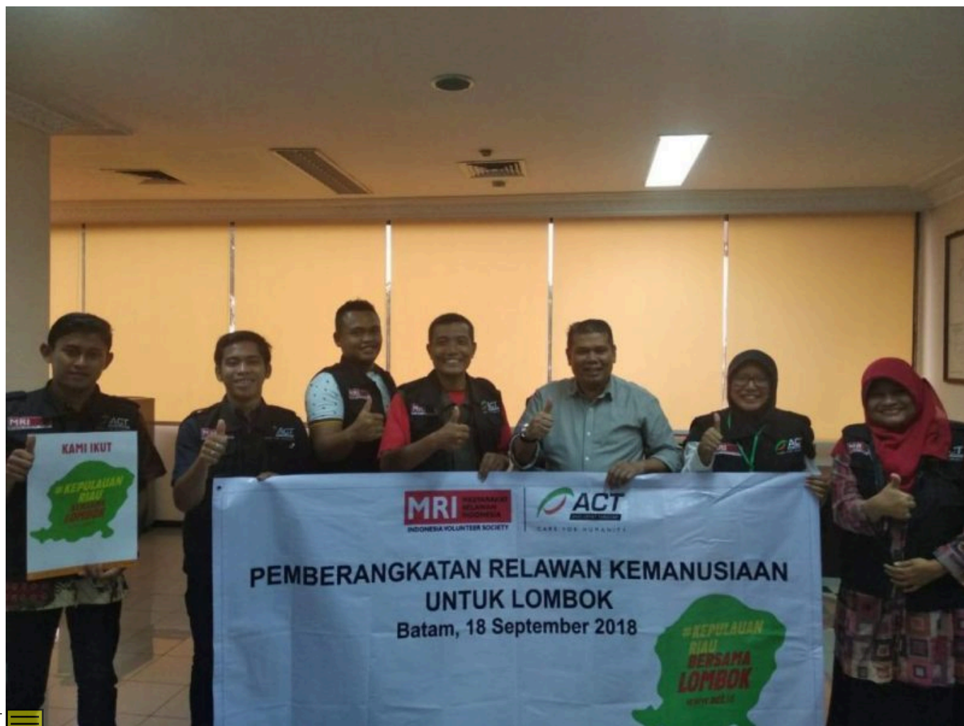
Tim Relawan MRI-ACT Kepulauan Riau

Pengiriman relawan ini juga merupakan ikhtiar kita untuk Lombok. Dengan semangat #KepulauanRiauBersamaLombok ,ACT Kepri mengajak masyarakat untuk bersama-sama membantu Lombok.